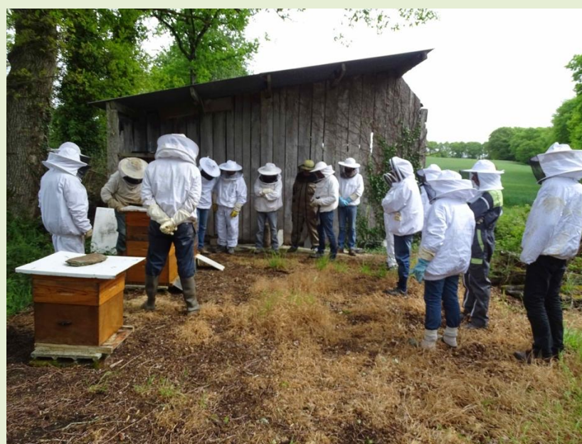
Groupe lors d'une activité sur le rucher