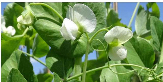
Petits pois en fleurs

Vous pouvez également cultiver le pois Gourmand dit « mangetout ». On le déguste dans sa totalité avec la gousse. C'est une plante similaire en taille et facile à cultiver et plutôt généreux au niveau de la production.