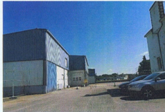
Photographies du secteur

Observations : Une étude en cours sur le devenir de ce secteur