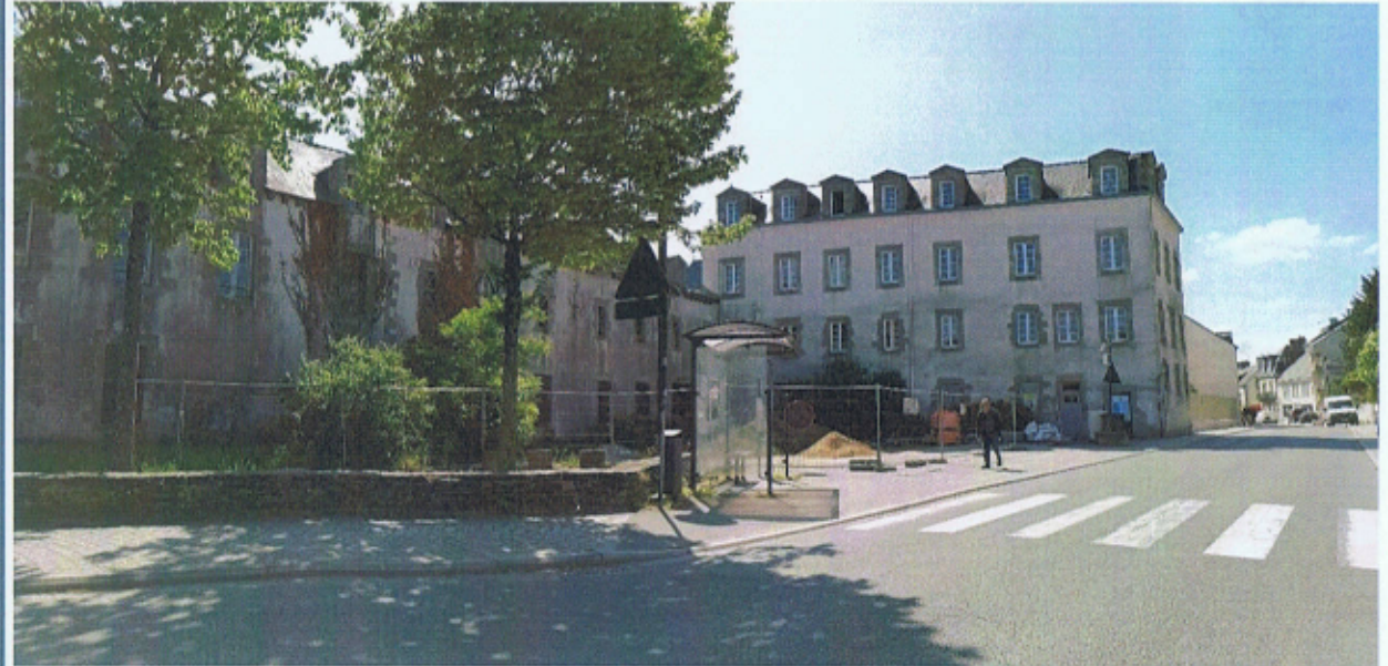
Photographie du secteur

Localisation : Rue Sénéchal Thuault Surface du terrain : - Topographie : Plat Impact agricole : Non Sensibilité écologique : Aucune Contexte paysager : Centre historique, cœur de ville Risques et nuisances : Bruit (rue Sénéchal Thuault) Accès/desserte : Oui Transport en commun : Immédiat Liaison douce : Immédiate Contexte urbain : Maisons de ville, petits collectifs, maisons individuelles Proximité de pôles : Centre (immédiat) Groupe scolaire (immédiat) Pôle d'équipements (600 m) Zones commerciales (700 m) Capacité des réseaux : Oui